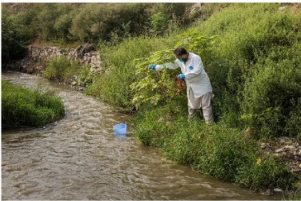
Surveillance des eaux usées, Quetta, Pakistan

Dernier cas de paralysie : 27 Janvier Dernière détection dans les eaux usées : 9 août